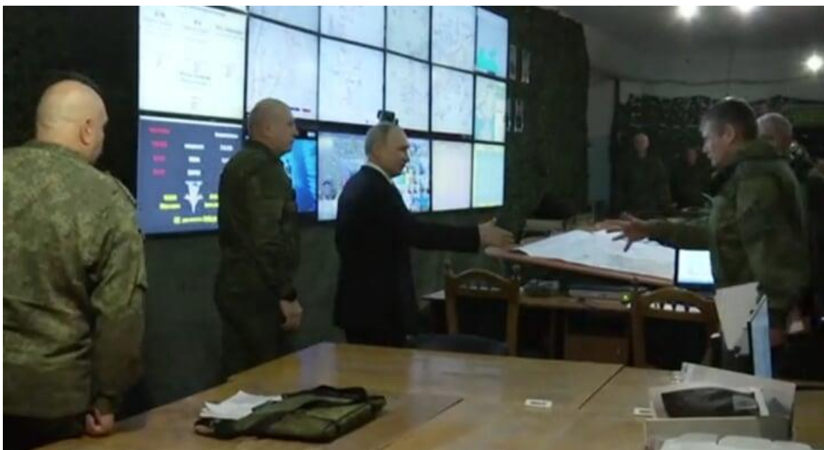
President Poetin bij het bezoek aan het Russische hoofdkwartier in de bezette Oekraïense regio Kherson

De echte boodschap van het icoon en van de nieuwe wetten is dat de oorlog in Oekraïne weer harder zal worden. Dat merkte Oekraïne direct. Rusland heeft de beschietingen met zware artillerie en het aantal luchtaanvallen weer opgevoerd, zei de commandant van de Oekraïense landmacht, generaal Oleksandr Syrskyi, dinsdag in een verklaring. Het tot voor kort door de Russische legerleiding verguisde Wagner huurlingenleger kreeg daarvoor bij TASS een prominente plek. Nadat Wagnereenheden het grootste deel van Bachmoet na maandenlange gevechten in handen hebben gekregen, zouden aanvalsteams nu ook twee gebieden van de stad Artyomovsk hebben 'bevrijd'.